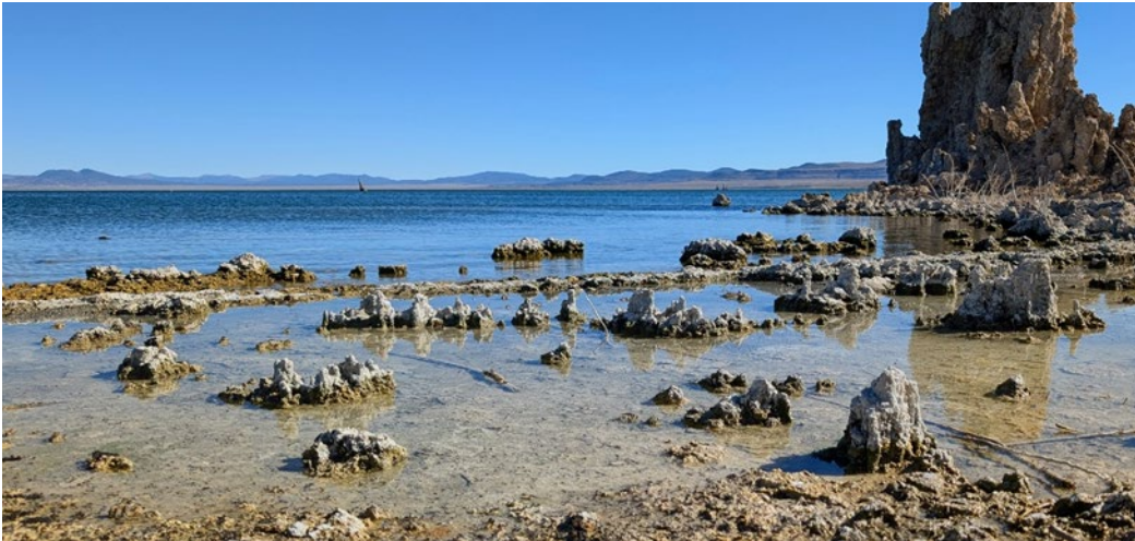
Figure 2. Mono Lake en Mono County, CA

El Grupo de Trabajo de Equidad Racial espera colaborar con el personal de la Junta de Agua de Lahontan y con las comunidades a las que servimos para desarrollar, perfeccionar e implementar el Plan de Acción.